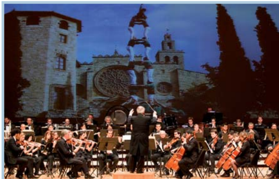
Durant el concert van projectar-se diverses imatges d'elements de la cultura tradicional i popular.

of Catalan dances”, de Benjamin Britten (1913-1976), en la qual apareix la melodia del “Paga-li, Joan”, la dansa tradicional que es balla cada any per la Festa Major de Sant Cugat.