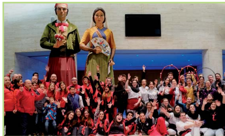
El concert “Les nostres tradicions” va comptar amb la col·laboració de les diferents entitats que formen part de la Coordinadora d'Entremesos de Cultura Popular i Tradicional Catalana de Sant Cugat del Vallès i també del Grup de Batucada Karabassà.