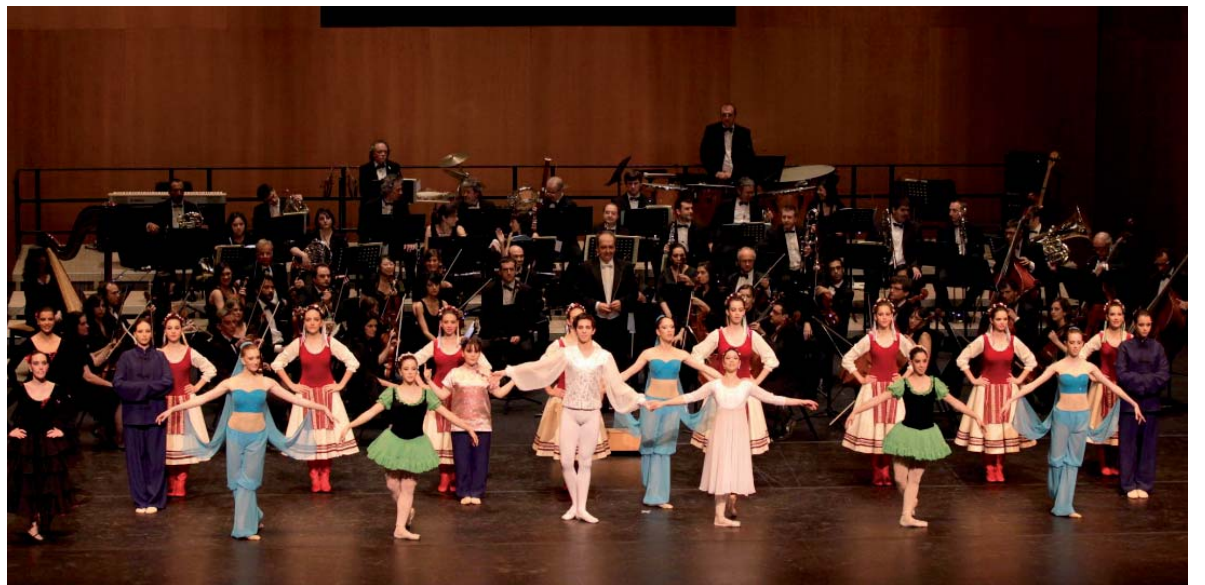
La música i la dansa també fan parella a "El Trencanous" de Txaikovski.