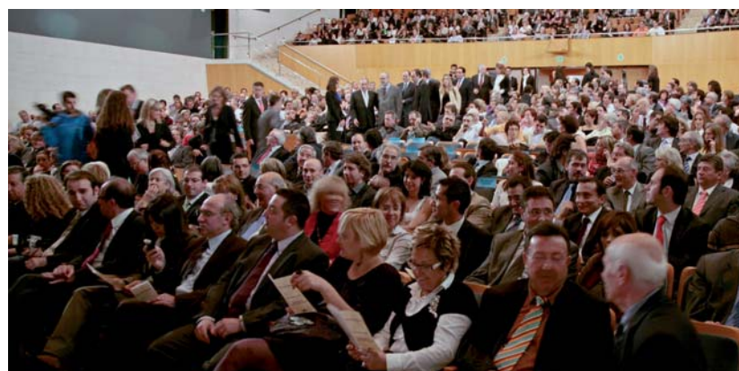
L'acte ha reunit nombrosos representants del sector de la metal·lúrgia de tot l'Estat, a més de personalitats del món polític i empresarial de Catalunya.