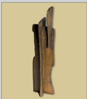
Tots els premiats han rebut aquesta escultura de Pablo Martínez.

“Unió” és el nom amb què l'escultor Pablo Martínez ha batejat l'escultura que li ha encarregat la UPM per al lliurament de premis de la primera Gala del Metall UPM 2008. L'escultura conté els conceptes de grup i d'unió. La idea, segons Martínez, va sorgir de la reflexió que dos elements units poden crear alguna cosa forta, però que tres units entre si estan creant unes condicions mínimes per a un grup, un grup de persones que s'associen per treballar en equip i aconseguir determinades fites. “Unió” és una peça formada per tres elements units en ferro colat. Una peça única en què l'autor ha posat tota la seva energia.