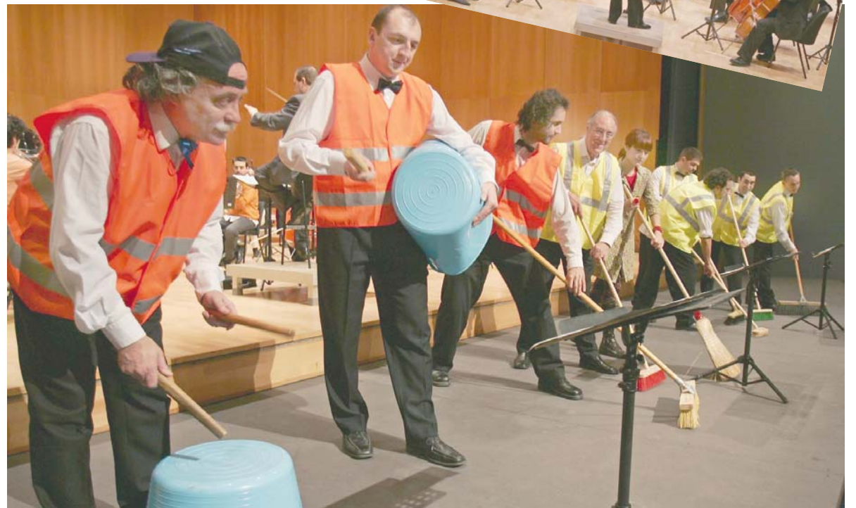
Els percussionistes de l'Orquestra han substituït els seus instruments per estris de neteja.