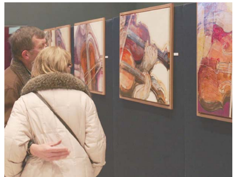
El públic ha gaudit també amb la mostra "Pinzellades d'harmonia", de Pere Soy, instal·lada al vestíbul del Teatre-Auditori amb motiu del concert.

El concert d'avui forma part de la gira que l'Orquestra Simfònica Sant Cugat fa entre desembre i gener en diferents municipis catalans: Sant Cugat (dues sessions), Castellbisbal, Barcelona, Badalona, Begues, Calaf, Mollet, El Prat de Llobregat, Soldeu (Andorra) i Reus. En total, l'Orquestra ofereix onze concerts amb el programa de valsos i danses.