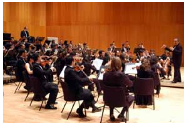
Imatge del concert "Valsos i danses", interpretat a l'Auditori de Sant Cugat